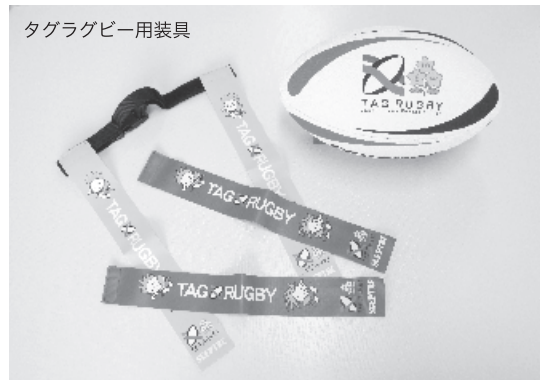
タグラグビー用装具

今回の体験教室では、天然芝の上でのびのびと体を動かしながら楕円形のボールにさわってみるところから始める入門編です。