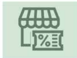
スタジアム店クーポン