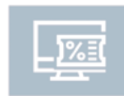
オンラインストアクーポン