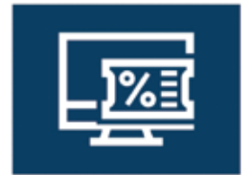
オンラインストアクーポン