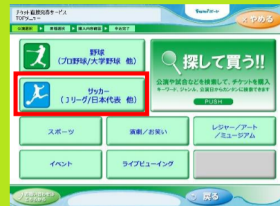
3、「サッカー」を選択します。