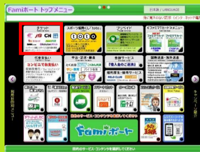
1、店頭Famiポート TOP画面からチケットを選択します。