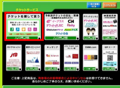
2、「チケットを探す」を選択します。