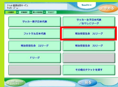
4、「明治アビスパFC J1リーグ」を選択します。