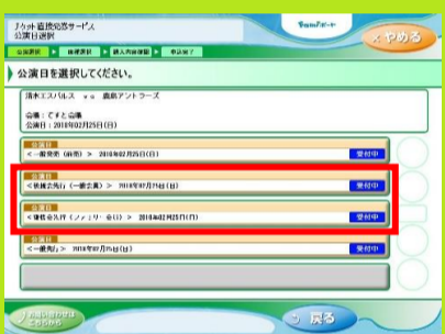
7、後援会先行一般会員もしくはファミリー会員を選択します。