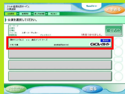
6、ご希望の試合を選択します。