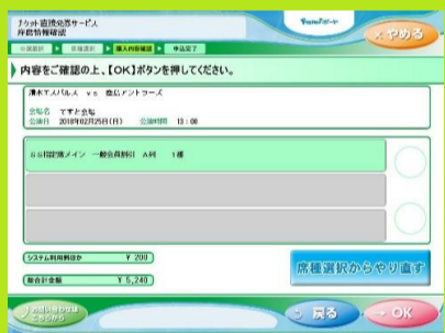
11、内容を確認いただき、「OK」を選択します。