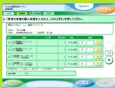
9、ご希望の席種・枚数を選択します。