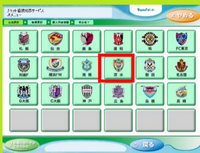
5、「清水エスパルス」を選択します。