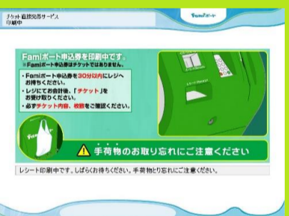
12、申込券が印刷されます。